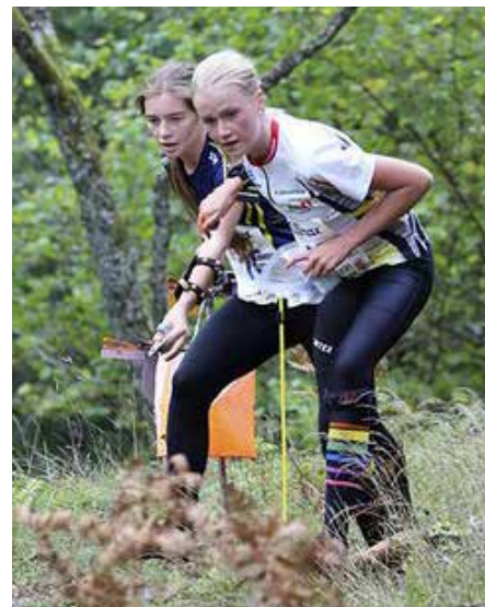
Löparfokus på USM i Falköping.