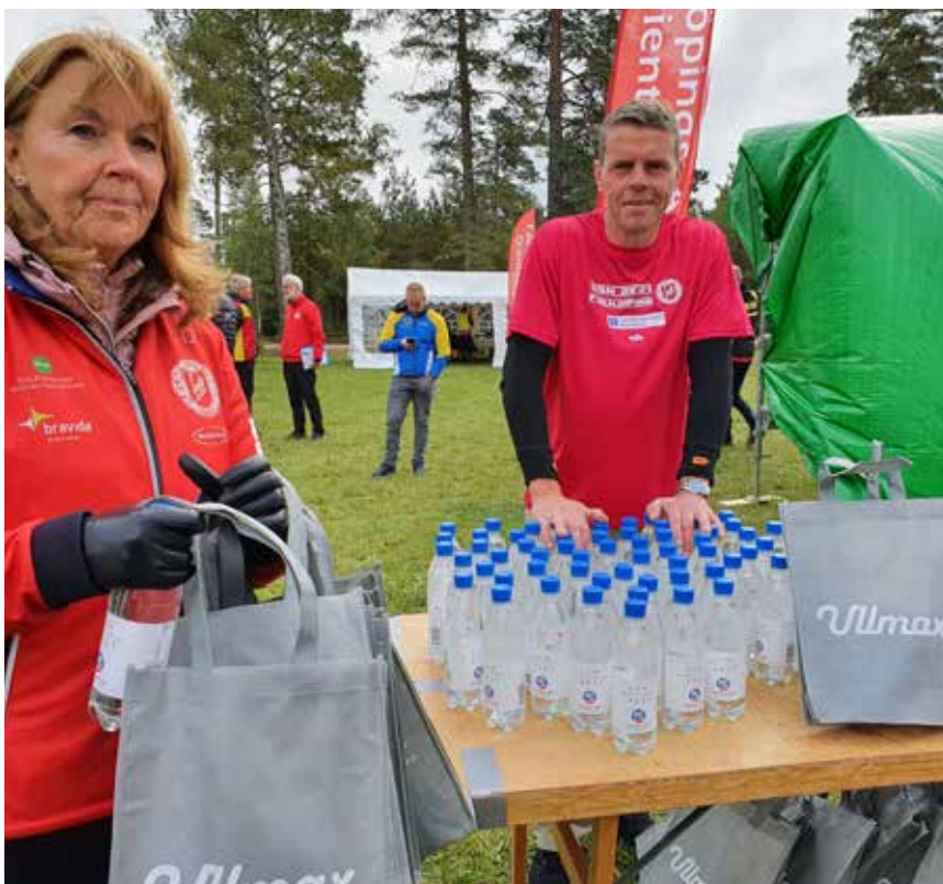
Det har inte varit helt lätt att planera och genomföra tävlingar under pandemin, men för Falköpings AIK OK blev det ju till slut Ungdoms SM i alla fall, med både tävlingar, priser och den svenska flaggan.