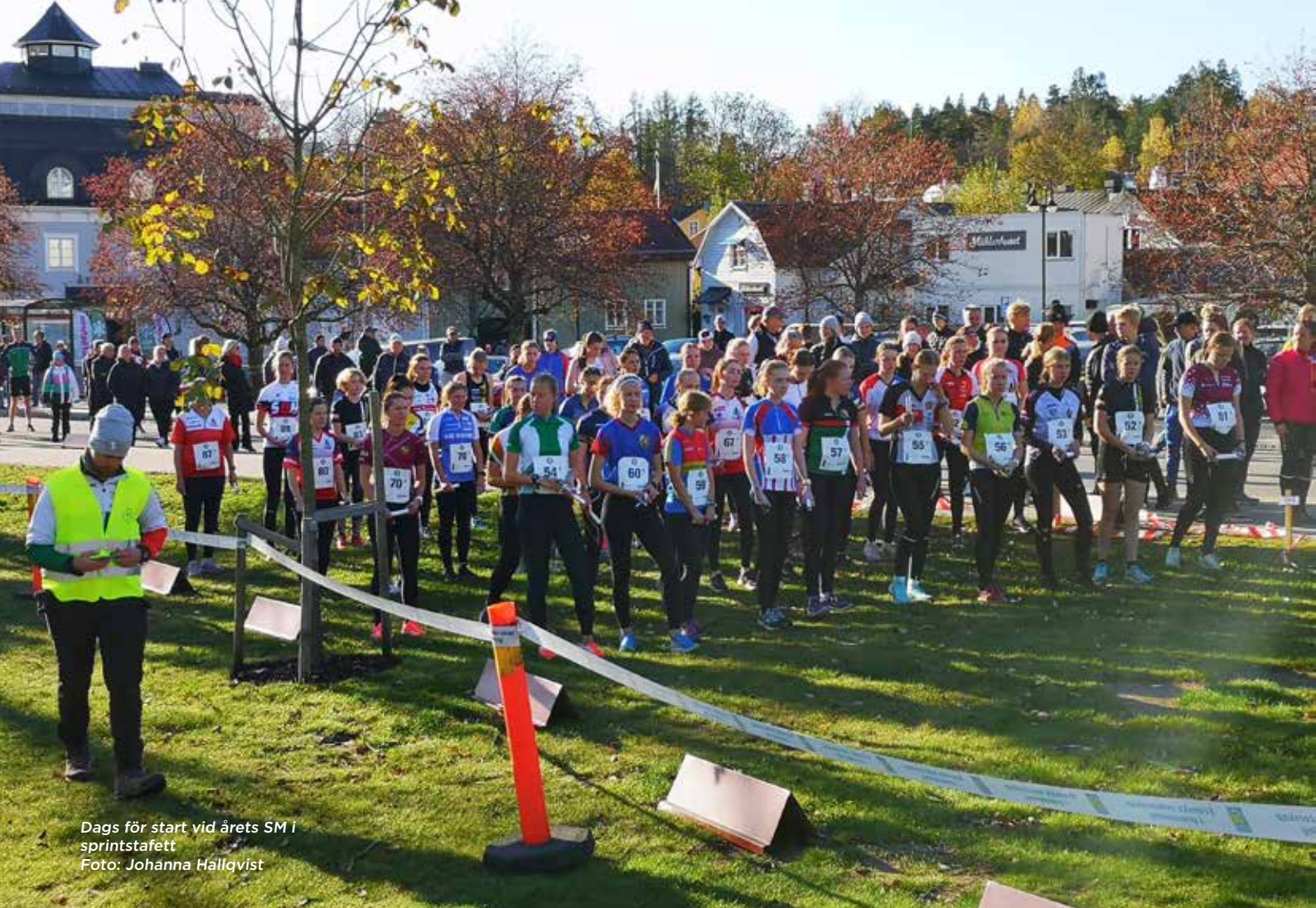
Dags för start vid årets SM i sprintstafett