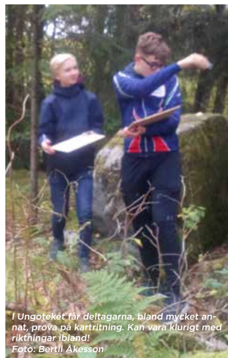
I Ungoteket får deltagarna, bland mycket annat, prova på kartritning. Kan vara klurigt med riktningar ibland!

Nu är en ny omgång av Ungoteket igång, med 20 nya ungdomar som får lära sig om hur orientering blir till. Programmet är komprimerat, så alla träffar är redan genomförda. Nu väntar föreningsprojekten som förhoppningsvis ska kunna genomföras som planerat under våren.