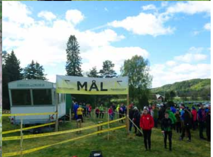
Bildkollage från årets Team Sportia League deltävlingar