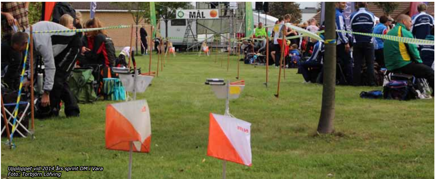
Upploppet vid 2014 års sprint DM i Vara