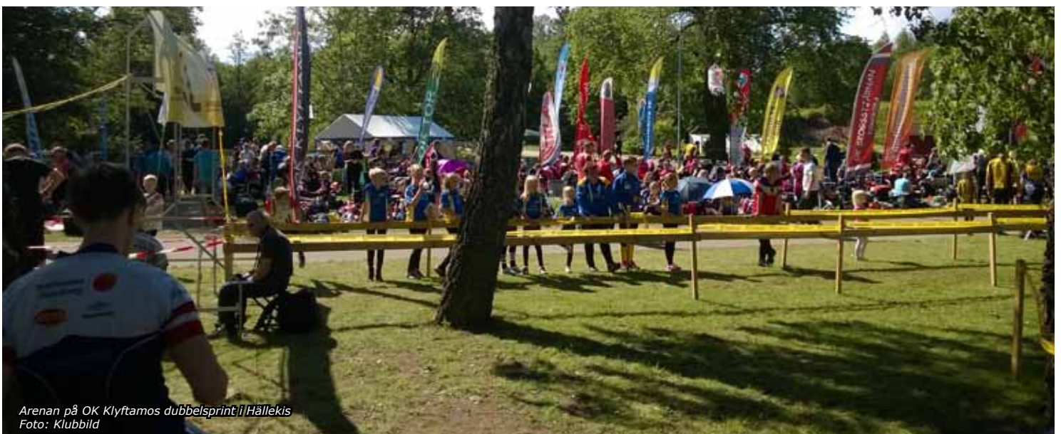
Arenan på OK Klyftamos dubbelsprint i Hällekis