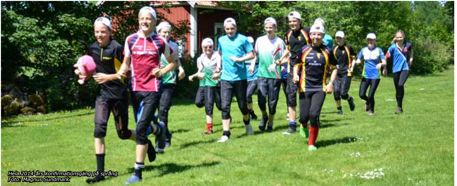
Hela 2014-års konfirmationsgång på språng