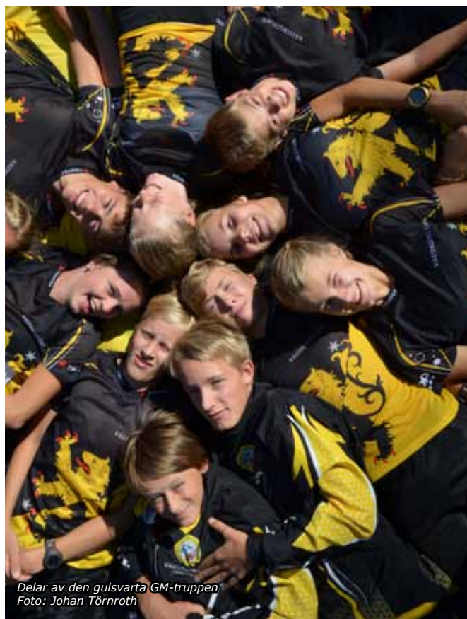
Delar av den gulsvarta GM-truppen