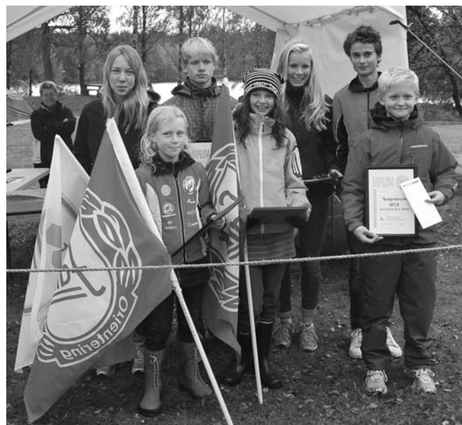
Klassegrarna i Westgota Cup 2010 radar upp sig efter finalen på Lång DM i Rydboholm den 19 september.