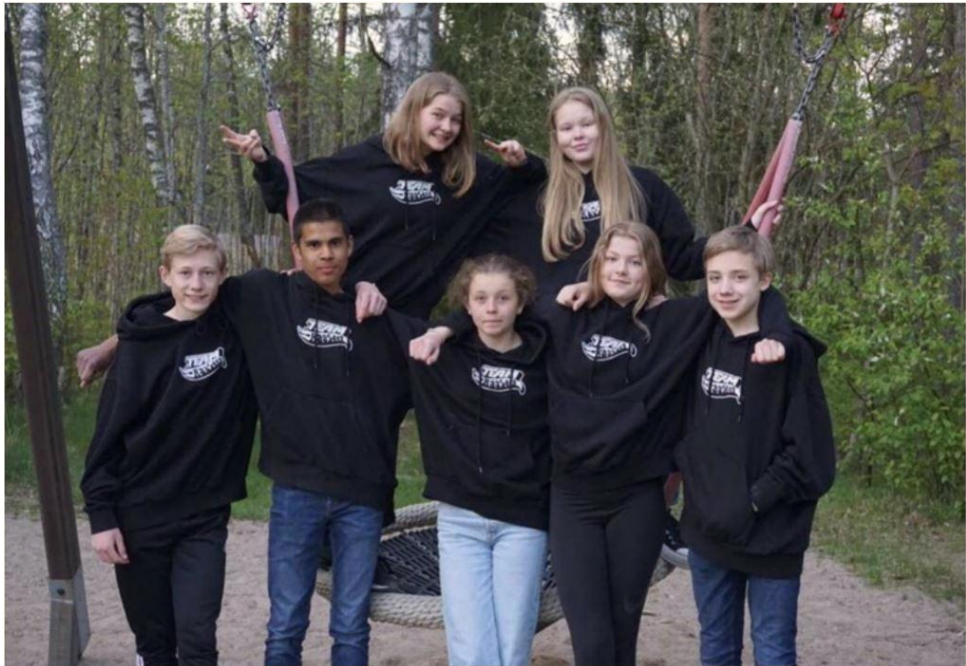
"Team Rääser", Garphyttans IF – arrangör av sommarens 5-dagars ungdomstävling