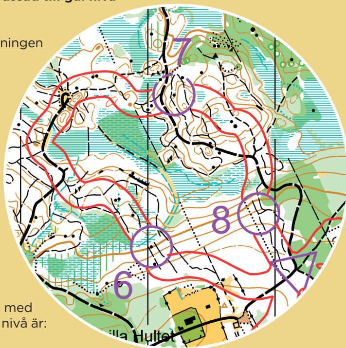
Bild: Exempel på korridor för gul nivå.

Återkoppla efteråt och fokusera på det som har gått bra.