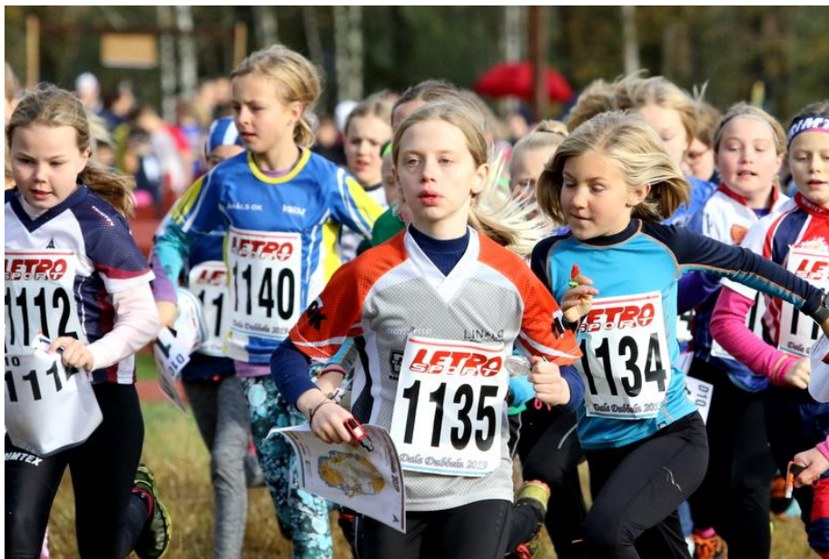
Starten i D10.