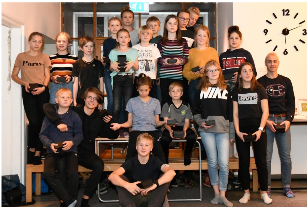
Alla vinnare av Hälsingepriiset som delades ut till de närvarande.