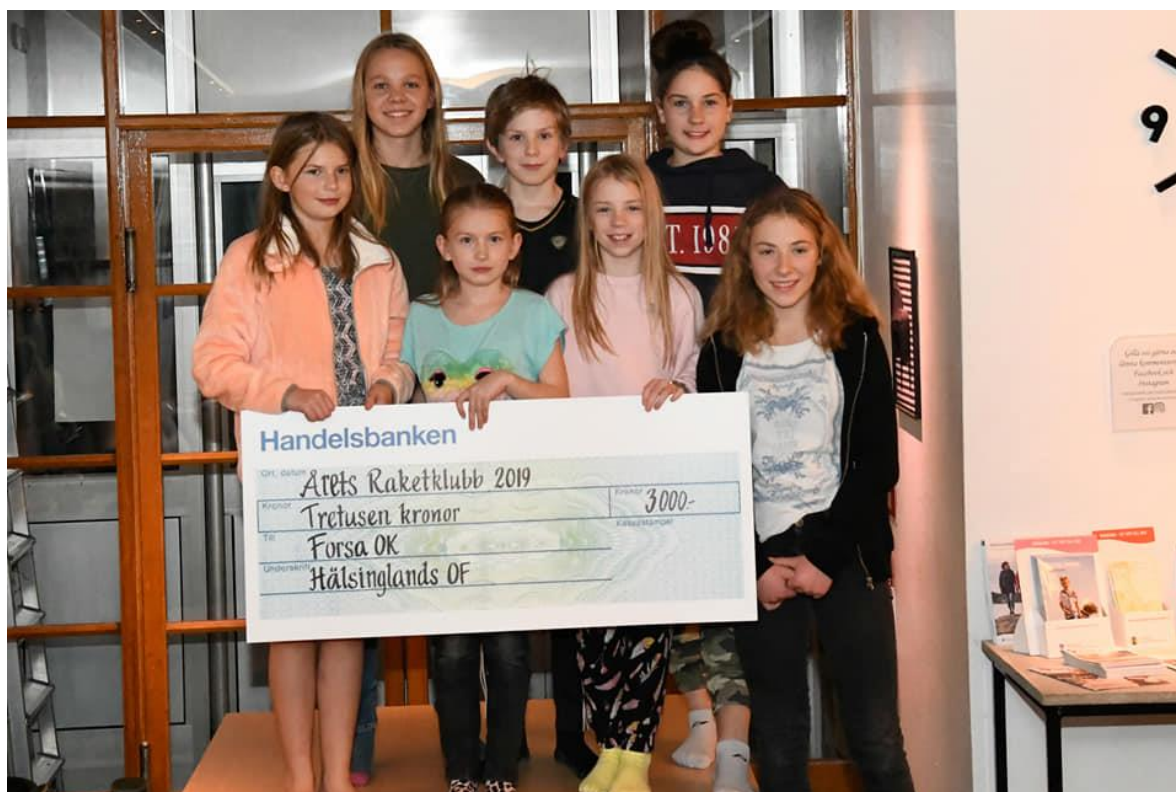
Årets raketklubb Forsa OK