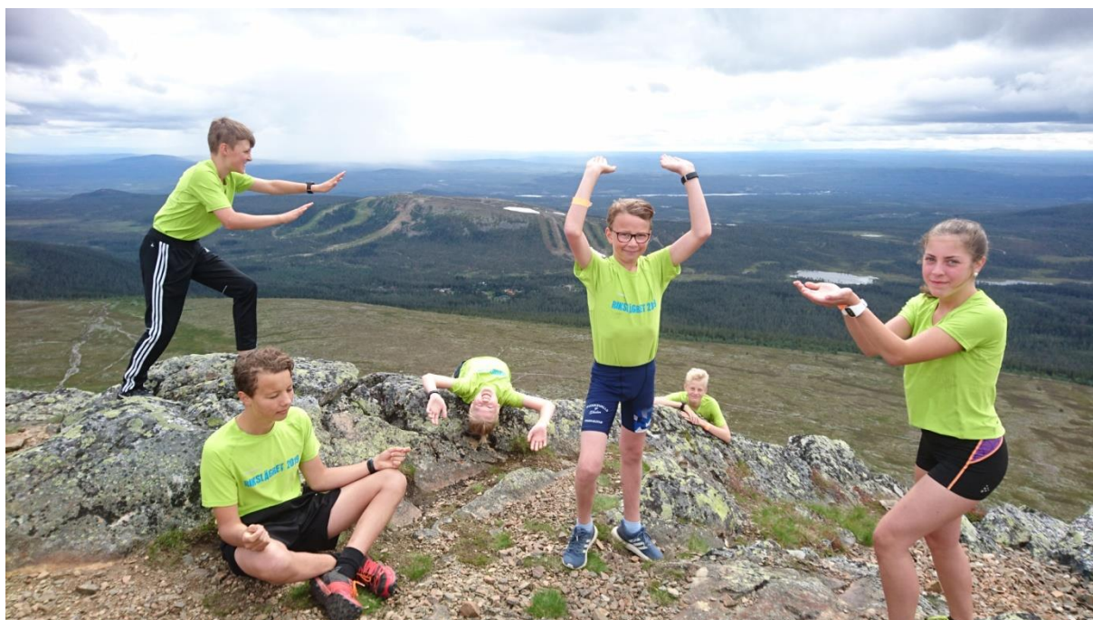
På Stadjans topp, i bakgrunden Idre Fjäll.

Vi hoppas att fler vill vara med under 2020 och sänder här en grupphälsning från oss som var med 2019.