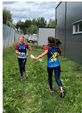
Ella o Elin möts under banan på Distriktsmatchens sprint