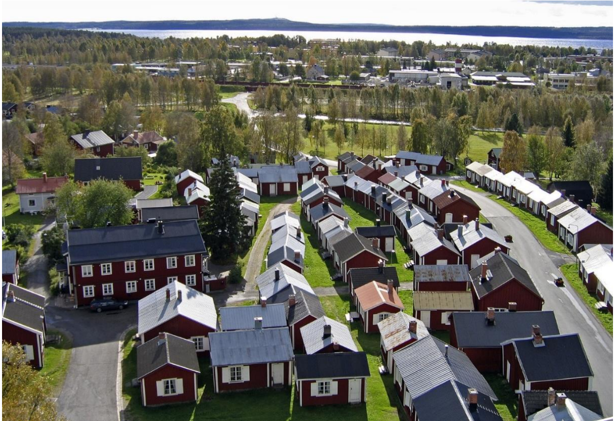
Foto som visar den avslutande delen av banorna med målgärdet bortom stugorna

Albin Blomberg och Wille Långberg sammanstrålade i Hudiksvall för gemensam resa till Luleå som avklarades med bil på eftermiddagen/kvällen dagen före sprinten som hade start på eftermiddagen. Förmiddagen ägnades åt kartpromenad i området, och vi lyckades täcka in hela tävlingsområdet med en del klurigheter. Efter lunch och karantän var det så dags för start.